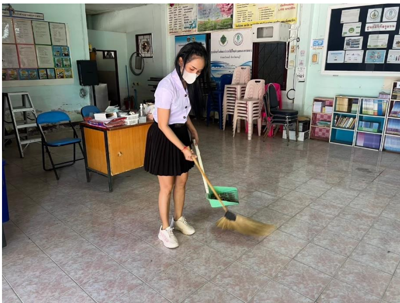
นักศึกษาทำความสะอาดทุกครั้งที่มาพบกลุ่ม หรือมาทำกิจกรรมที่ ศกร.ตำบลหนองทรายขาว