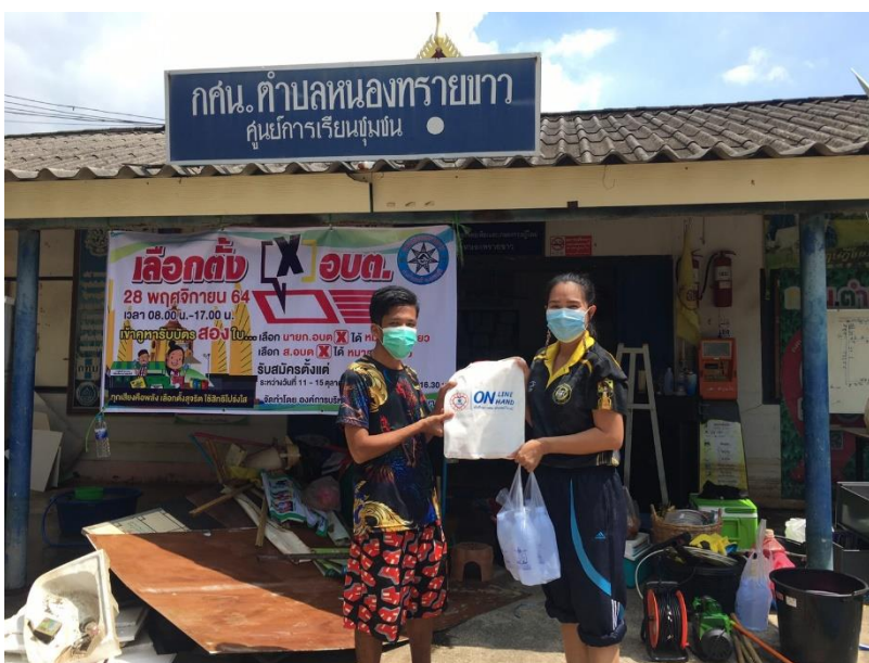
ศกร.ตำบลหนองทรายขาว หลังน้ำลด ในเหตุการณ์น้ำท่วม ปี ๒๕๖๔ ทำความสะอาด เก็บของใน ศกร.ตำบล ที่ไม่สามารถขนขึ้นที่สูงได้ เนื่องจากโต๊ะที่ใช้ในการวางของไม่เพียงพอ จึงมีสิ่งของจำนวนมากจมน้ำ ได้รับความเสียหาย เมื่อน้ำลดได้ทำความสะอาด เก็บของที่เสียหายทิ้ง และมอบของช่วยเหลือให้นักศึกษาที่บ้านน้ำท่วมด้วย