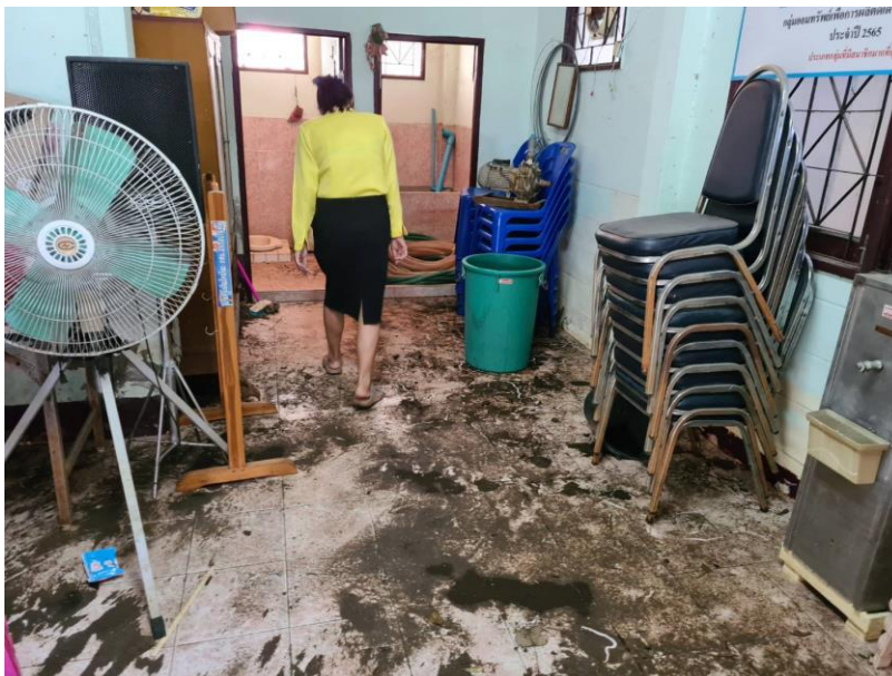
ศกร.ตำบลหนองทรายขาว หลังน้ำลด ในเหตุการณ์น้ำท่วม ปี ๒๕๖๔ ทั้งสภาพความเสียหายค่อนข้างเยอะ สิ่งของบางส่วน ไม่สามารถขนหนีน้ำได้ เนื่องจากโต๊ะตั้งของมีไม่เพียงพอ จำเป็นต้องปล่อยให้จมน้ำ