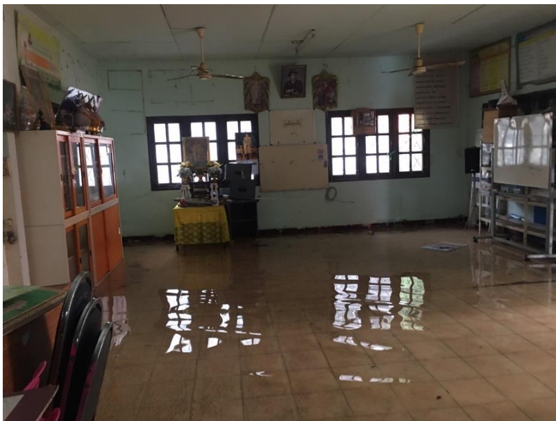
ศกร.ตำบลหนองทรายขาว น้ำท่วม เข้าบริเวณด้านใน ศกร.ตำบล