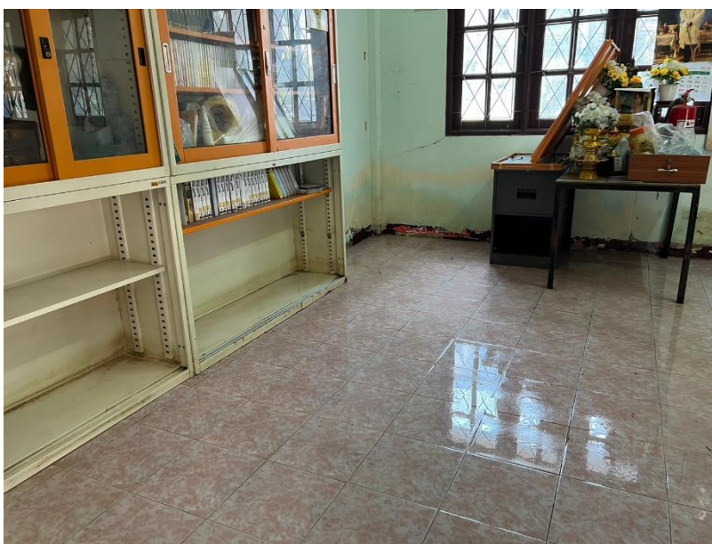
ศกร.ตำบลหนองทรายขาว ทำความสะอาดหลังน้ำลด โดยจัดเก็บของชั้นหนังสือ และเอาขนของลงเข้าที่เพื่อพร้อมให้บริการกับผู้มาใช้บริการ