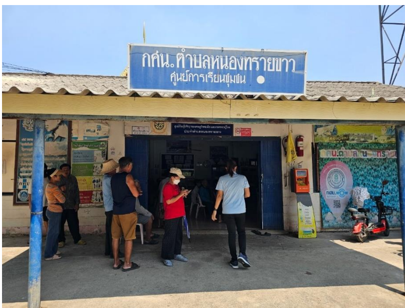
ศกร.ตำบลหนองทรายขาว เปิดบริการ Wifi ฟรี ให้กับประชาชนได้ใช้บริการตลอด ๒๔ ชั่วโมง ทำให้มีเด็ก ประชาชน มานั่งเล่นบริเวณ ศกร.ตำบลหนองทรายขาว ตลอดเวลา