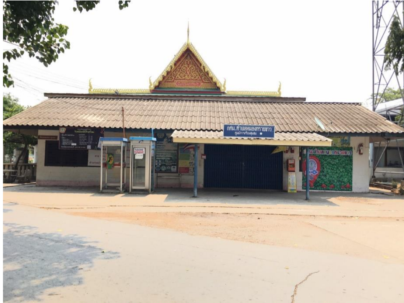
บริเวณโดยรอบ ศกร.ตำบลหนองทรายขาว

๑. สภาพอาคารอยู่ในสถานที่มั่นคง มีความเป็นสัดส่วนและปลอดภัย