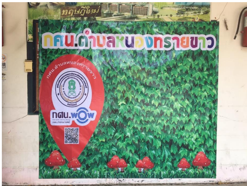
ป้ายจุดเช็คอิน (Check in) ป้ายเก่า จัดทำเมื่อ เดือน มีนาคม ๒๕๖๓

๘. เป็นจุดเช็คอิน (Check in) ที่ส่งผลต่อการเรียนรู้ของผู้เข้าใช้บริการ