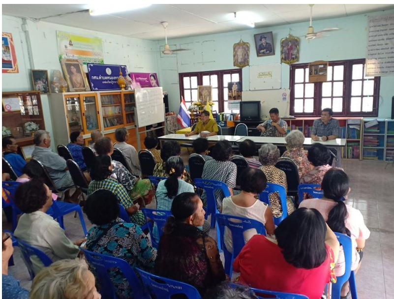
ศกร.ตำบลหนองทรายขาว มีสิ่งอำนวยความสะดวกที่หลากหลายที่เอื้อต่อการเรียนรู้ โดยมีชาวบ้านมาใช้บริการในการประชุมของหมู่บ้าน การประชุมของ อบต.