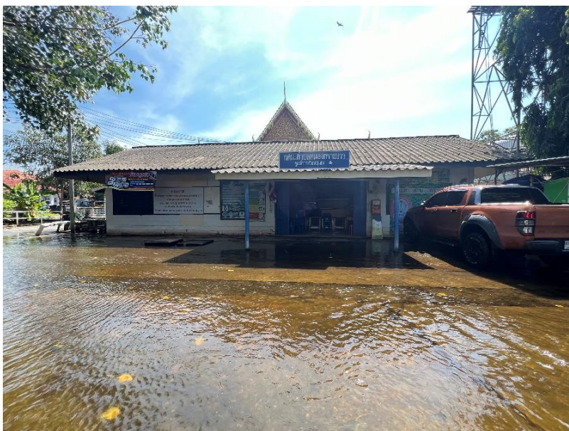
น้ำท่วม ศกร.ตำบลหนองทรายขาว เมื่อปี ๒๕๖๕