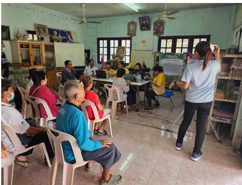
ศกร.ตำบลหนองทรายขาว มีสิ่งอำนวยความสะดวกที่หลากหลายที่เอื้อต่อการเรียนรู้ โดยมีชาวบ้านมาใช้บริการในการทำบัตรประชาชนที่หมดอายุ ของ รพ.สต.หนองทรายขาว