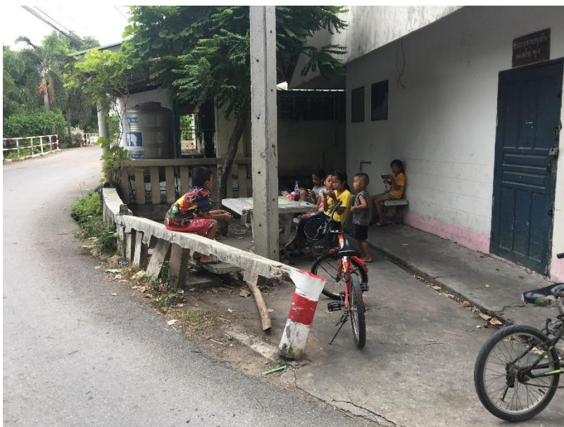
ศกร.ตำบลหนองทรายขาว เปิดบริการ Wifi ฟรี ให้กับประชาชนได้ใช้บริการตลอด ๒๔ ชั่วโมง ทำให้มีเด็ก ประชาชน มานั่งเล่นบริเวณ ศกร.ตำบลหนองทรายขาว ตลอดเวลา