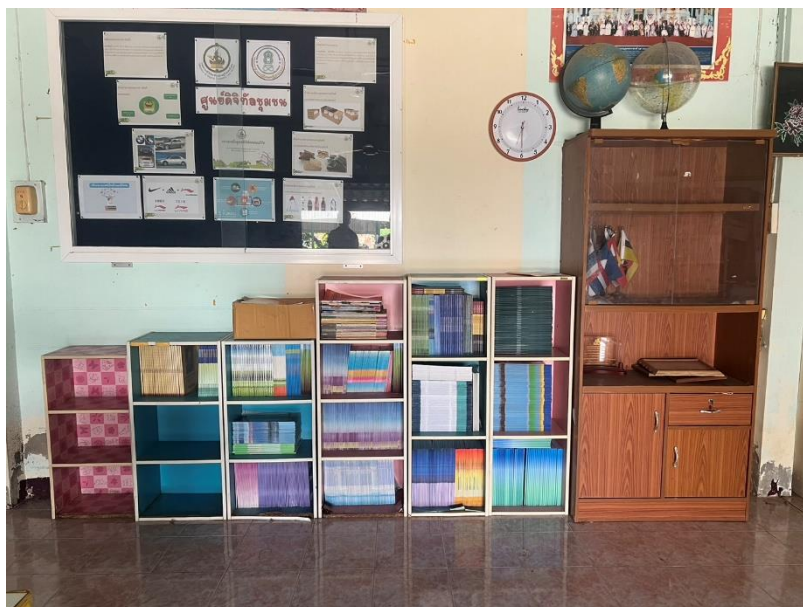
ศกร.ตำบลหนองทรายขาว ทำความสะอาดหลังน้ำลด โดยจัดเก็บของชั้นหนังสือ และเอาขนของลงเข้าที่เพื่อพร้อมให้บริการกับผู้มาใช้บริการ