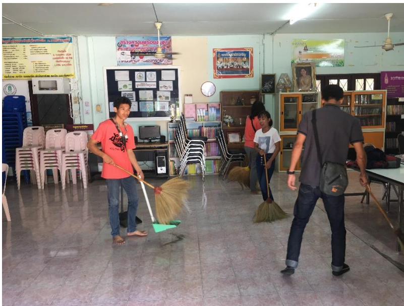
นักศึกษาทำความสะอาดทุกครั้งที่มาพบกลุ่ม หรือมาทำกิจกรรมที่ ศกร.ตำบลหนองทรายขาว