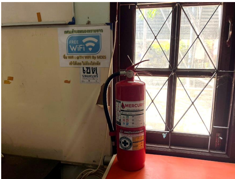
ป้ายแจ้งการเข้าใช้บริการ Wifi ฟรี เข้าใช้ผ่านชื่อ @TH WiFi By MDES โดยไม่มีรหัสผ่าน

๗. เป็นสถานที่ที่ใช้ประโยชน์จากเทคโนโลยี ในการเรียนรู้ของผู้ใช้บริการ ได้แก่ Internet, Wifi, สื่อการเรียนรู้ออนไลน์ เป็นต้น