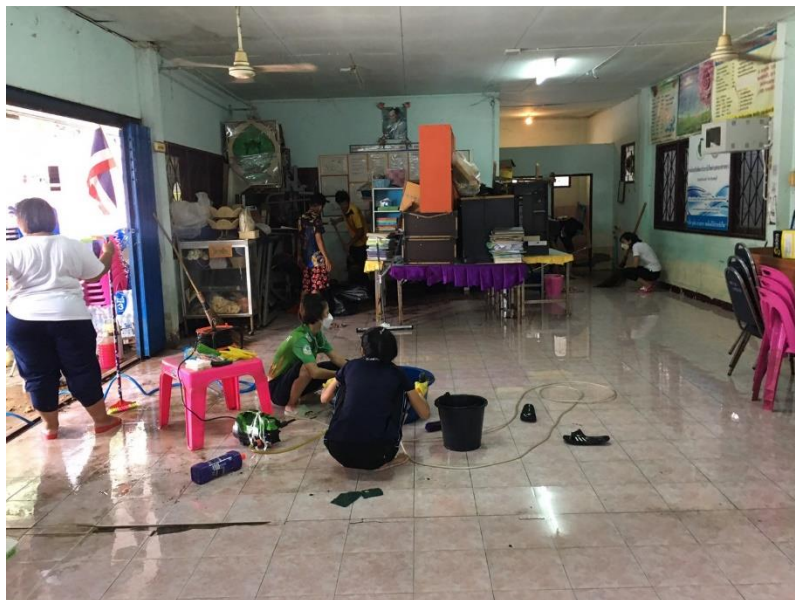
ศกร.ตำบลหนองทรายขาว ทำความสะอาดหลังน้ำลด โดยจัดเก็บของขึ้นหน้าน้ำ และเอาขนของลงเข้าที่เพื่อพร้อมให้บริการกับผู้มาใช้บริการ