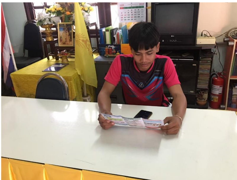
ศกร.ตำบลหนองทรายขาว คิวอาร์โค้ด (QR Code) ปะติดไว้ภายใน ศกร.ตำบล เพื่อให้ความรู้ด้านต่างๆ กับผู้ใช้บริการ รวมทั้งมีแบบประเมินการใช้งานแปะไว้ให้ผู้มาใช้บริการทำการประเมิน