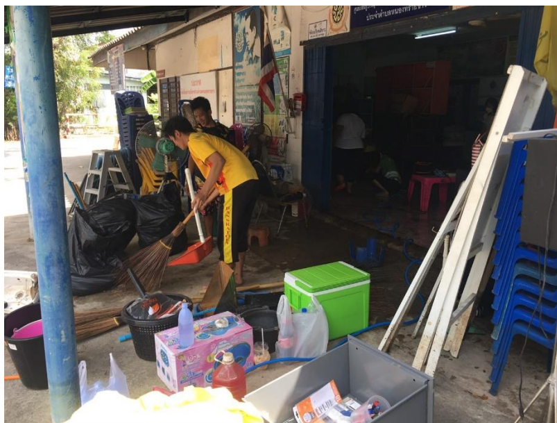
ศกร.ตำบลหนองทรายขาว ทำความสะอาดหลังน้ำลด โดยจัดเก็บของชั้นหนึ่งน้ำ และเอาขนของลงเข้าที่เพื่อพร้อมให้บริการกับผู้มาใช้บริการ