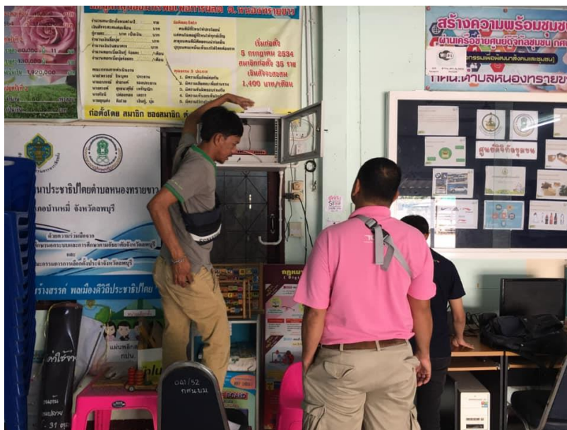
บริษัท TOT เข้าติดตามการใช้งานอินเทอร์เน็ตของ ศกร.ตำบลหนองทรายขาว ให้พร้อมบริการกับประชาชน บริเวณ ศกร.ตำบล ซึ่งจะมีเด็ก ชาวบ้าน มาใช้บริการตลอดเวลา