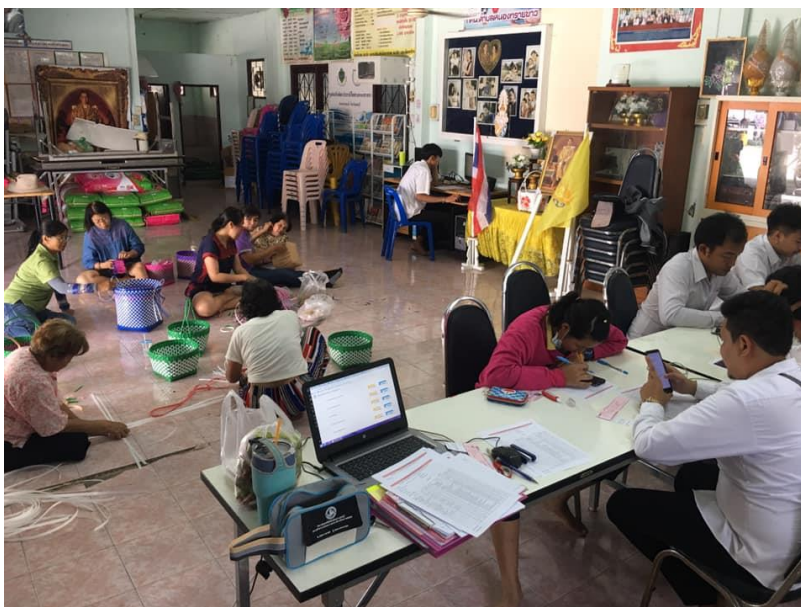
ศกร.ตำบลหนองทรายขาว มีสิ่งอำนวยความสะดวกที่หลากหลายที่เอื้อต่อการเรียนรู้ โดยมีชาวบ้านมาใช้บริการเรียนหลักสูตรการสานเส้นพลาสติก พร้อมกับสอบกลางภาคของนักศึกษา