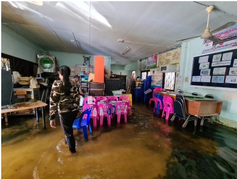
น้ำท่วม ศกร.ตำบลหนองทรายขาว เมื่อปี ๒๕๖๔

๒. มีการจัดสภาพแวดล้อม โดยยึดหลัก ๕ ส (สะอาด, สะดวก, สะอาด, สุขลักษณะ, สร้างนิสัย) และสะอาดตา