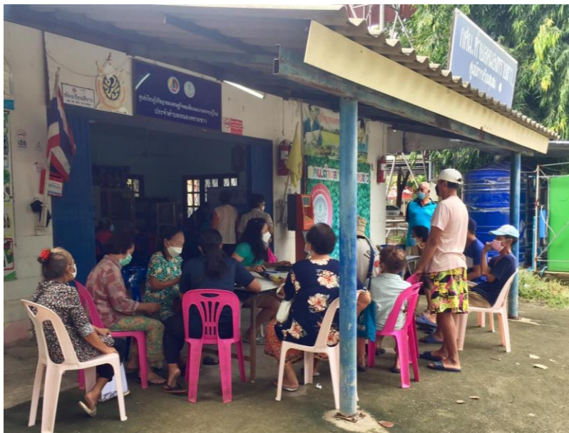
ศกร.ตำบลหนองทรายขาว มีสิ่งอำนวยความสะดวกที่หลากหลายที่เอื้อต่อการเรียนรู้ โดยมีชาวบ้านมาใช้บริการในการดำเนินงานของ รพ.สต.หนองทรายขาว