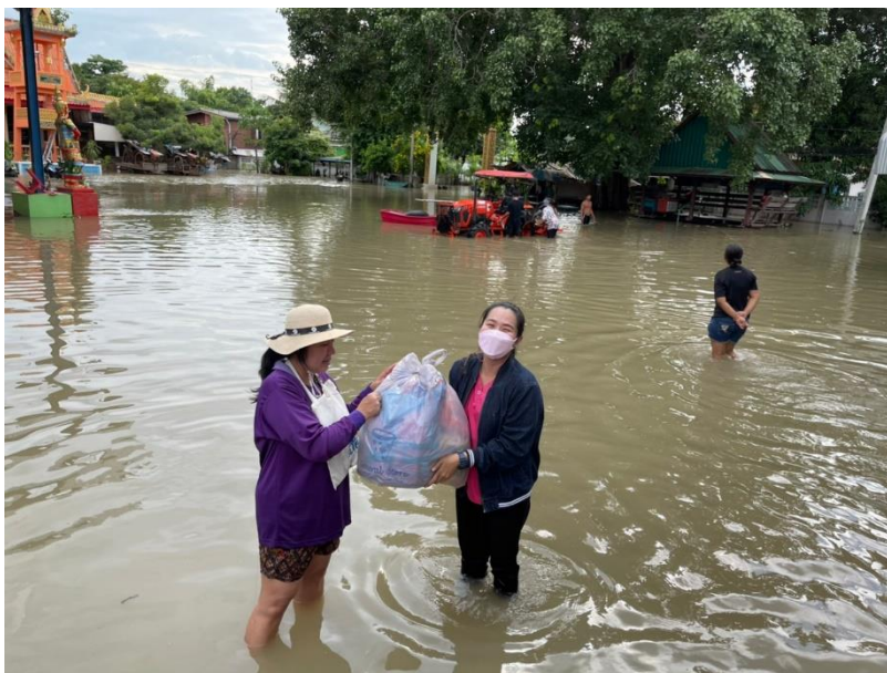
ครู ศกร.ตำบลหนองทรายขาว นำของใช้เบื้องต้น อาหารแห้ง เสื้อชูชีพ ช่วยเหลือเครือข่าย ที่ไม่สามารถเดินทางออกไปซื้อของใช้ที่จำเป็นได้ ในเหตุการณ์น้ำท่วม ปี ๒๕๖๔