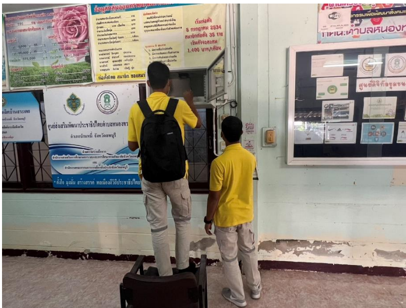
ศกร.ตำบลหนองทรายขาว คิวอาร์โค้ด (QR Code) ปะติดไว้ภายใน ศกร.ตำบล เพื่อให้ความรู้ด้านต่างๆ กับผู้ใช้บริการ รวมทั้งมีแบบประเมินการใช้งานแปะไว้ให้ผู้มาใช้บริการทำการประเมิน

๙. มีการจัดทำรหัสคิวอาร์โค้ด (QR Code) เพื่อใช้ในการศึกษา เรียนรู้ ข้อมูลต่างๆ