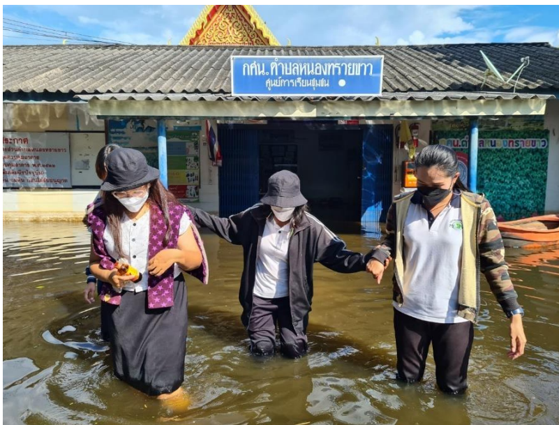
น้ำท่วม ศกร.ตำบลหนองทรายขาว เมื่อปี ๒๕๖๔

ศกร.ตำบลหนองทรายขาว มีสถานที่ตั้งอยู่บริเวณวัดสระเตยใหญ่ ที่ตั้งเป็นเนินสูง แต่ด้วยพื้นที่เป็นสถานที่รับน้ำในช่วงฤดูฝน น้ำฝนที่ตกสะสมไหลมาจากทางเหนือของอำเภอบ้านหมี่ ปริมาณน้ำจะไหลมาสะสมที่ตำบลหนองทรายขาว จึงทำให้บริเวณตำบลหนองทรายขาวในช่วงเดือน กันยายน - พฤศจิกายน ของทุกปี จะถูกน้ำท่วมเต็มบริเวณ เกิดความเดือดร้อนกับประชาชนอย่างมาก เพราะพื้นที่ทั้งหมดจะถูกตัดขาดการสัญจร รถเล็กไม่สามารถเข้าไปได้ ต้องใช้การสัญจรด้วยรถยกสูง รถไถ เรือ เท่านั้น ด้วยสภาพปัญหาดังกล่าว จึงอยากสะท้อนความลำบากของนักศึกษา ประชาชน รวมถึงการทำงานของ ศกร.ตำบลหนองทรายขาว ที่จะต้องมีความพยายามในการเข้าถึงพื้นที่ การดูแลทรัพย์สินของทางราชการ และความช่วยเหลือของนักศึกษา ประชาชนหลังน้ำลด