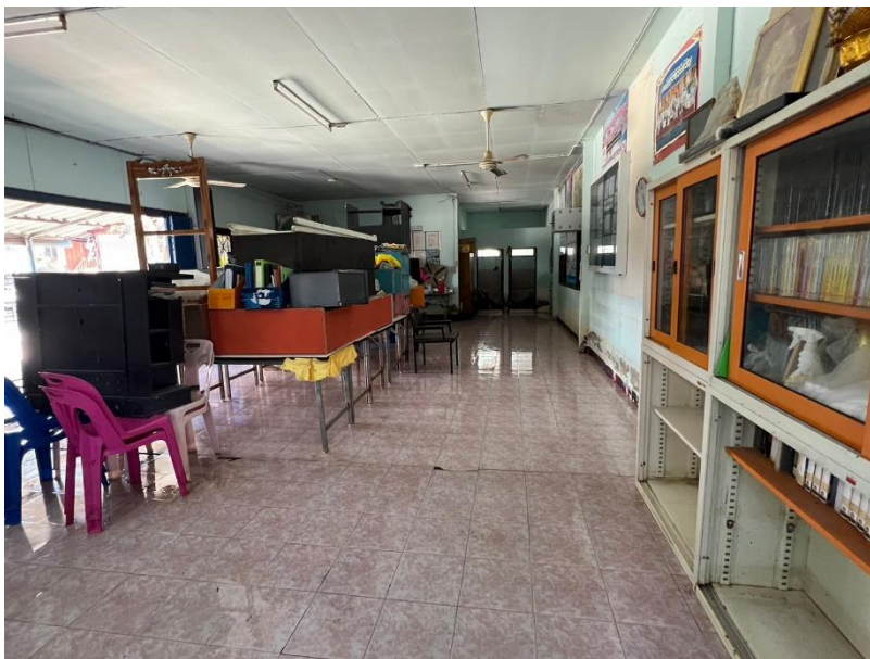
ศกร.ตำบลหนองทรายขาว ทำความสะอาดหลังน้ำลด โดยจัดเก็บของชั้นหนังสือ และเอาขนของลงเข้าที่เพื่อพร้อมให้บริการกับผู้มาใช้บริการ