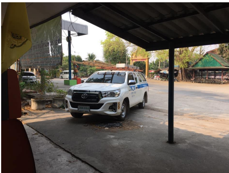
บริษัท TOT เข้าติดตามการใช้งานอินเทอร์เน็ตของ ศกร.ตำบลหนองทรายขาว ให้พร้อมบริการกับประชาชน บริเวณ ศกร.ตำบล ซึ่งจะมีเด็ก ชาวบ้าน มาใช้บริการตลอดเวลา