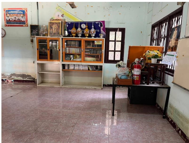
ศกร.ตำบลหนองทรายขาว ทำความสะอาดหลังน้ำลด โดยจัดเก็บของขึ้นหน้าน้ำ และเอาขนของลงเข้าที่เพื่อพร้อมให้บริการกับผู้มาใช้บริการ