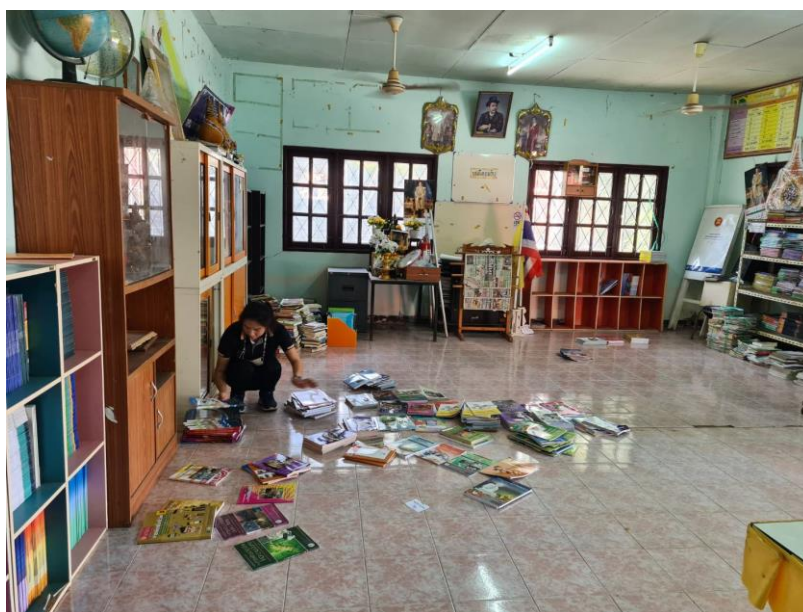
ศกร.ตำบลหนองทรายขาว ทำความสะอาดหลังน้ำลด โดยจัดเก็บของชั้นหนึ่งน้ำ และเอาขนของลงเข้าที่เพื่อพร้อมให้บริการกับผู้มาใช้บริการ