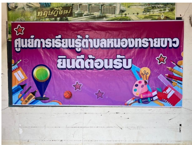
ป้ายจุดเช็คอิน (Check in) ป้ายใหม่ จัดทำเมื่อ เดือน มีนาคม ๒๕๖๗