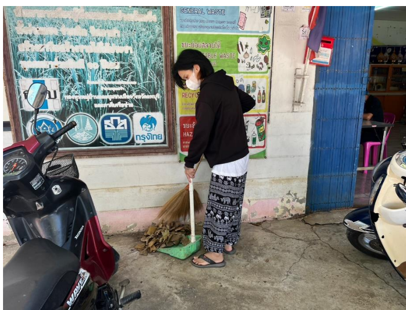
นักศึกษาทำความสะอาดทุกครั้งที่มาพบกลุ่ม หรือมาทำกิจกรรมที่ ศกร.ตำบลหนองทรายขาว